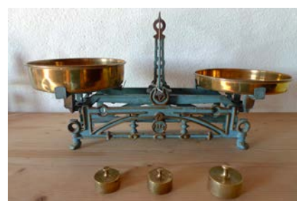
Rechnen mit der Waage, um 1920