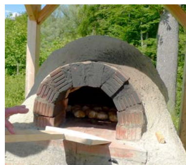
Lehmbackofen (C.Harfmann) im Sigl-Haus-Hof

Kulturverein Sigl-Haus, 2021 Sigl-Haus-Weg 1, 5113 St. Georgen